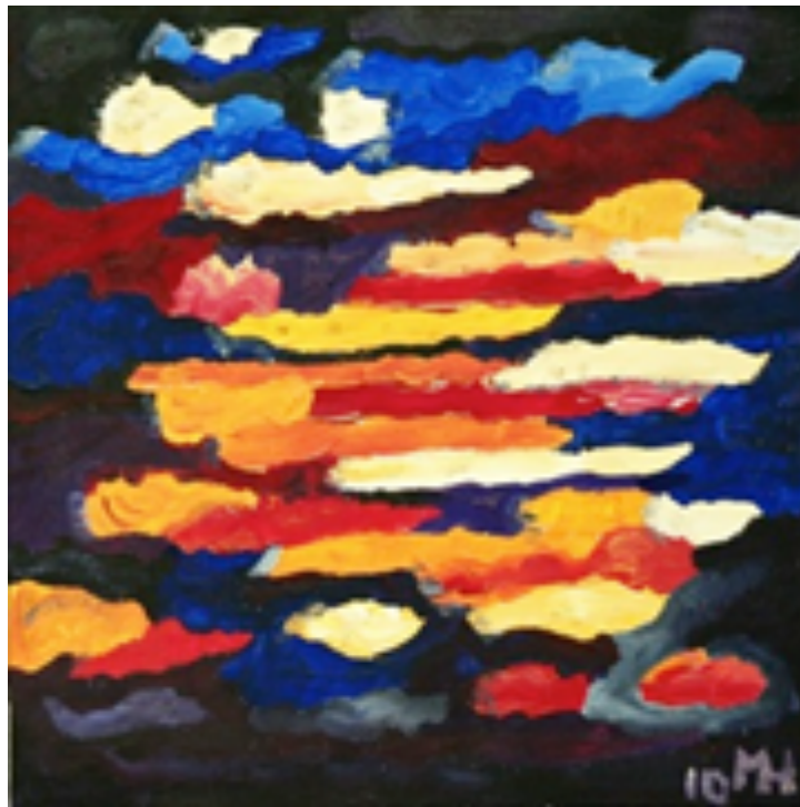
Electric Jazz (Jazz Electrico) , acrylic on panel (acrilico sobre panel)